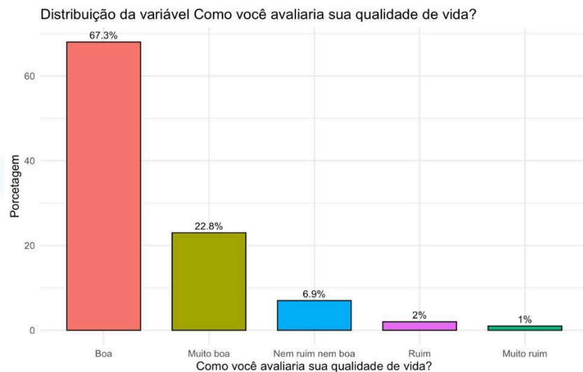
Gráfico 1: Distribuição da variável. Como você avaliaria sua qualidade de vida?