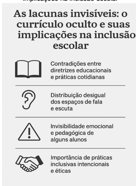
Figura 3 - Lacunas invisíveis: o currículo oculto e suas implicações na inclusão escolar