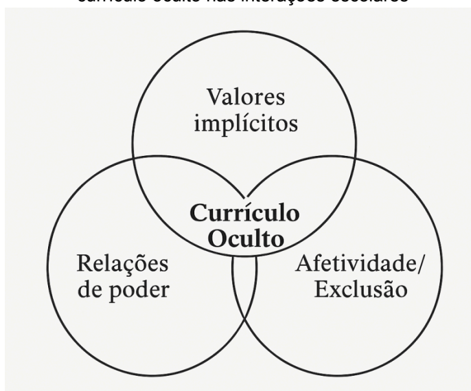
Figura 1 - Representação teórica das expressões do currículo oculto nas interações escolares